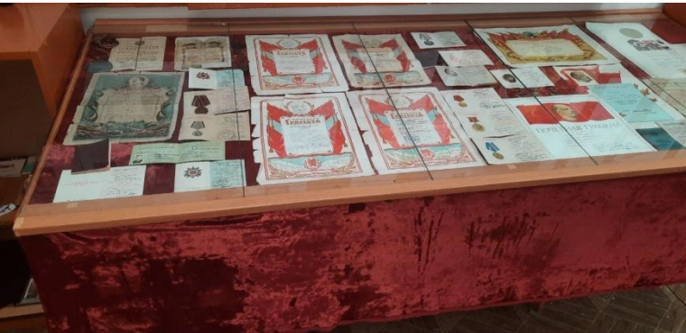
Документы жителей с.Новокрасного

и принимать другую точку зрения, договариваться друг с другом, заботиться о младшем, проявлять уважение к старшим.