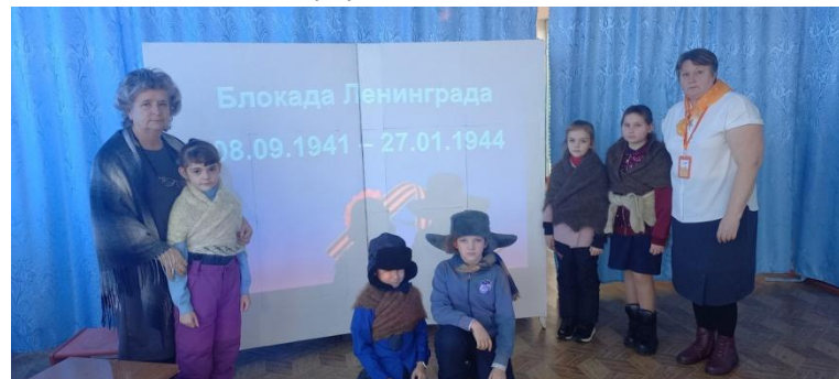
«Урок в блокадном Ленинграде».

Театр – коллективное творчество индивидуальностей. Дети всегда хотят быть неповторимыми. Они любят перевоплощаться, превращаться, играя друг с другом. В этом им помогает наш курс внеурочной деятельности «Мир театра». На фоне всех остальных кружков именно театральные кружки позволяют ребёнку развиваться во всех направлениях, раскрывать творческие способности, что очень важно для будущего.