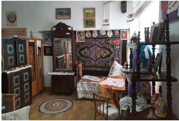
Быт жителей начала и середины 20 века