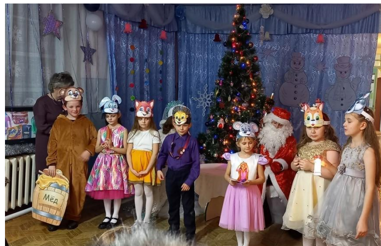
Подарки для деда Мороза

Школьный театр - уникальная развивающая среда для школьников. Школьный театр – это, прежде всего, развитие ребёнка в деятельностной сфере, поскольку здесь он может показать себя, раскрыть свои возможности и творческие способности.