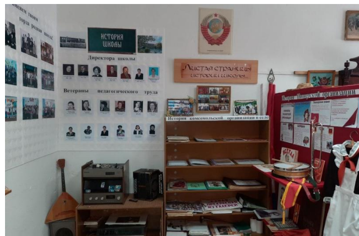
История школы, комсомольской и пионерской организаций Продолжение на следующей странице

Музей - это не только «кладёзь» памяти, хранилище старинных вещей, это и вечно живое прошлое, без которого нет будущего. Все экспонаты музея «говорят», «живут», «воспитывают».