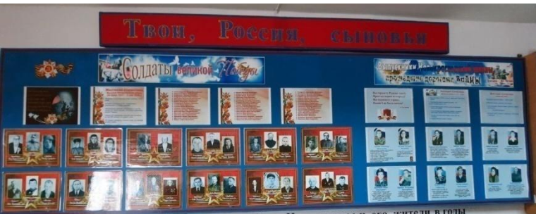
Твои, Россия сыновья!